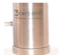
SANUNO inoxF mit Fuß

Weitere Informationen, Gutachten, Zertifikate und aktuelle Entwicklungen finden Sie im Internet unter www.carbonit.com / Mein Filter.