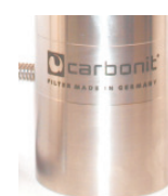
SANUNO inoxS Standard